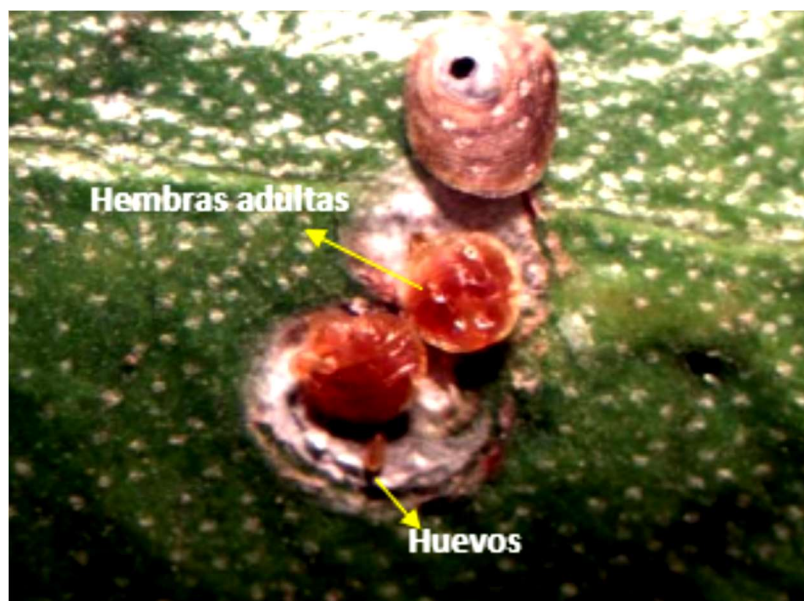
Figura 2. Acutaspis paulista . Hembra adulta. Característica del cuerpo, vista dorsal del cuerpo.