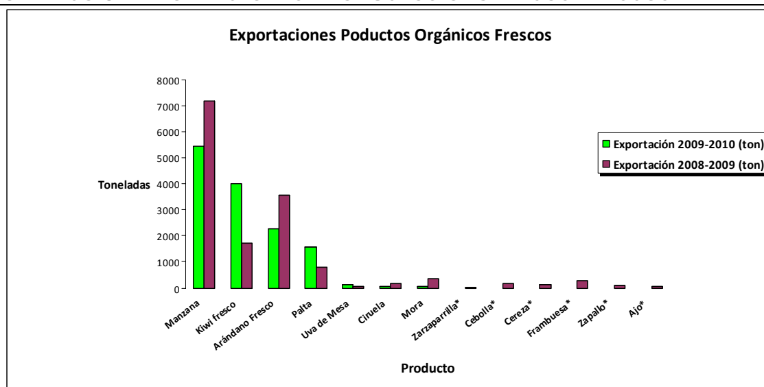
GRÁFICO 3: EXPORTACIONES PRODUCTOS ORGÁNICOS FRESCOS

*no hay registros exportación producto en temporada 2009-2010