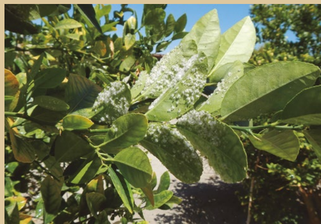
Serocidades de la mosquita algodonosa de los cítricos ( Aleurothrixus floccosus ). Parabemisia myricae no las produce.