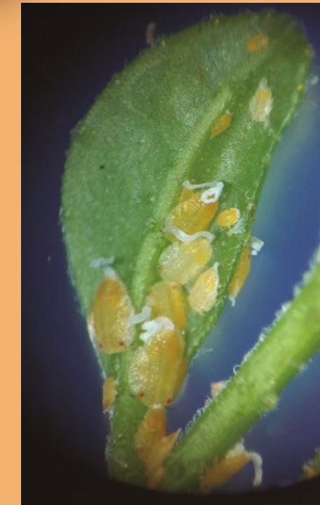
Ninfas con excreciones serosas.

Los adultos son pequeños insectos (3 a 4 mm) que se alimentan con su cabeza hacia abajo tocando la superficie vegetal formando con el cuerpo un ángulo de 45°.