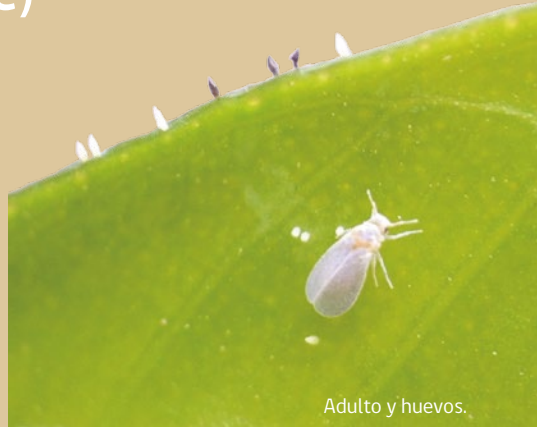
Adulto y huevos.

Las ninfas de forma oval con los ojos de color rojo, pasan de ser casi transparente (lo que dificulta su detección) a amarillo a medida que