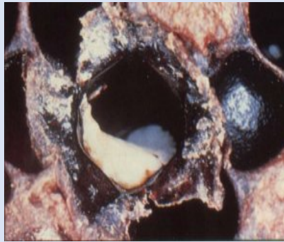
Imagen II. Escama adherida débilmente en la base de la celdilla.

https://abejas.org/las-abejas/patologias-de-las-abejas/loque-europea/