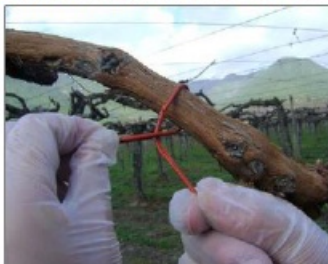
Figura 1. Instalación correcta de emisores en vid.

Los emisores deben quedar ubicados sobre la altura de la fruta o lo más alto posible dentro de la canopia, en el pitón o cargador (Figura 1) evitando dejarlos demasiado ajustado y/o expuestos directamente al sol, ya que esto podría provocar una emisión abrupta de la feromona. El emisor deberá ser instalado realizando solo un giro, para no entorpecer la emisión de la feromona. Tampoco se deben dejar muy holgados porque con las aplicaciones de plaguicidas los emisores se podrían salir. No se podrá colocar el emisor en el alambre, ni en la misma planta donde hay una trampa (Figura 2).