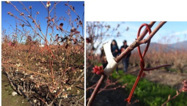
Figura 3. Instalación de emisores en plantas de arándano.

Los emisores deberán ser instalados en el sector más alto del arbusto, tratando siempre que esté por sobre la altura de la fruta, en la madera del año o del año anterior de la plata, quedando dentro de la vegetación y evitando su exposición directa al sol. Con el fin que quede firme en el arbusto, colgar el emisor en la bifurcación de las ramillas más gruesas.