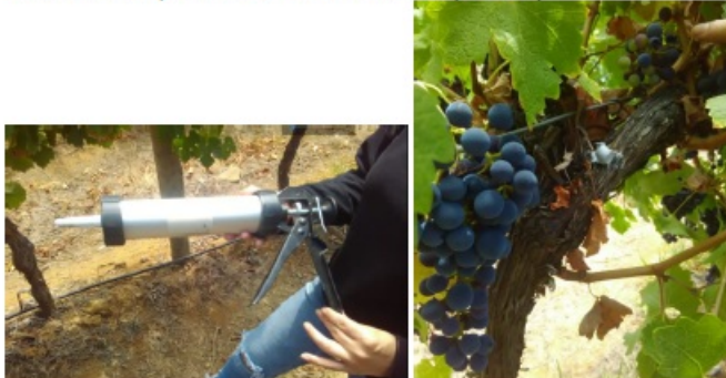
Figura 5. Herramienta para aplicar la porción de Splat Lobesia (izquierda). Splat Lobesia recién aplicado en la madera de la vid (derecha)

Feromona sintética de formulación emulsión acuosa compuesta por aceites, cera y agua. Su uso está autorizado para vides, arándanos y ciruelos. La cantidad recomendada para el control de Lobesia botrana es 1 kg por hectárea distribuido en 1.000 puntos por hectárea, ofreciendo un periodo de protección de al menos 50 días post aplicación.