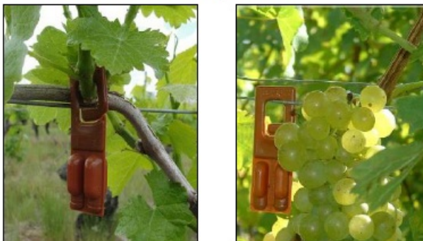
Figura 4. Instalación de emisores Rak 2 plus en vides.

Por el diseño del emisor, la instalación de Rak 2 plus se puede realizar directamente en el alambre, pitón o en el cargador, evitando dejarlos demasiado ajustado y/o expuestos directamente al sol (Figura 4). No colocar emisores en la misma planta donde ya hay instalada una trampa de Lobesia botrana .